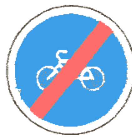
4.5.2 Конец велосипедной дорожки