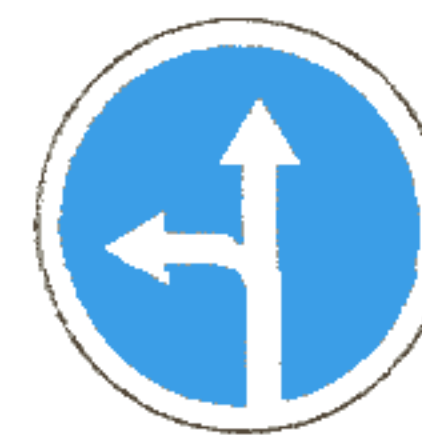
4.1.5 Движение прямо или налево