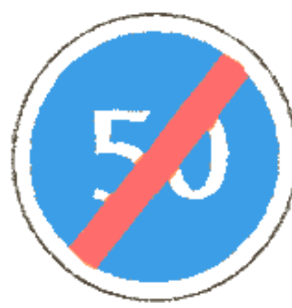
4.8 Конец зоны ограничения минимальной скорости