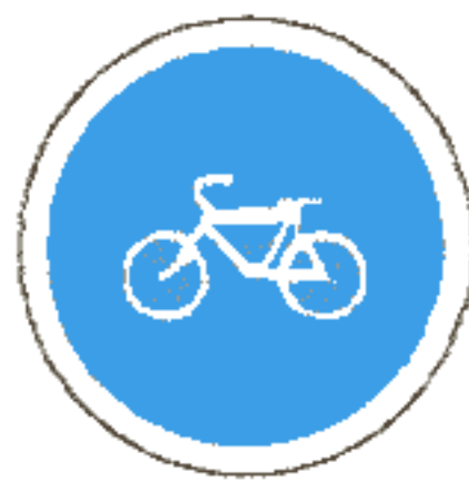
4.5.1 Велосипедная дорожка