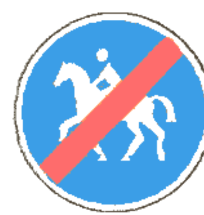
4.10.2 Конец дорожки для всадников