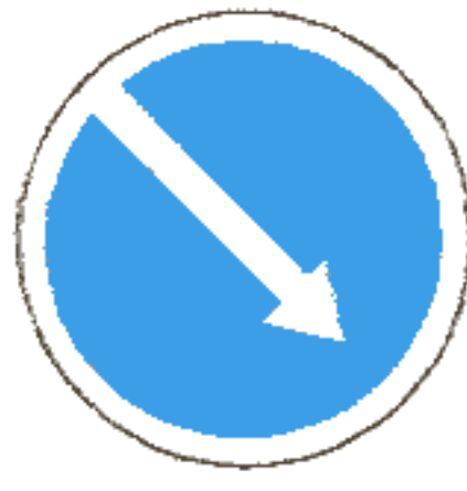
4.2.1 Объезд препятствия справа