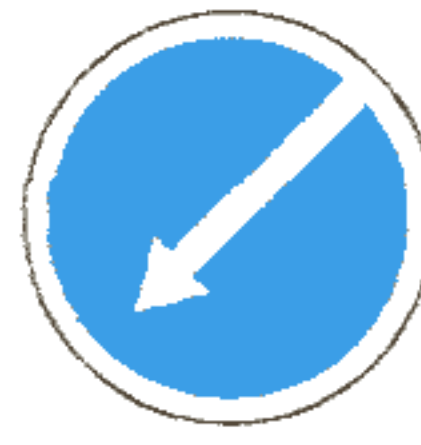
4.2.2 Объезд препятствия слева