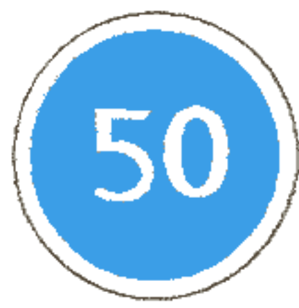
4.7 Ограничение минимальной скорости