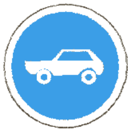
4.4 Движение легковых автомобилей