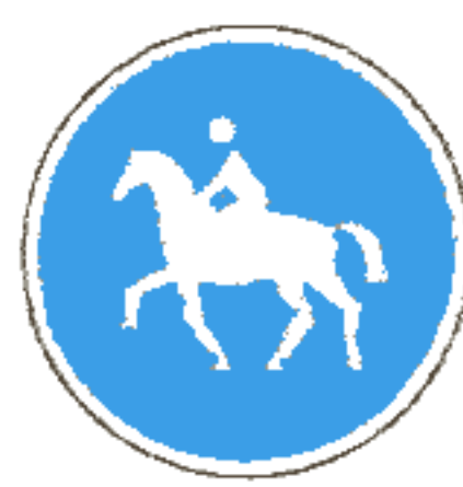
4.10.1 Дорожка для всадников