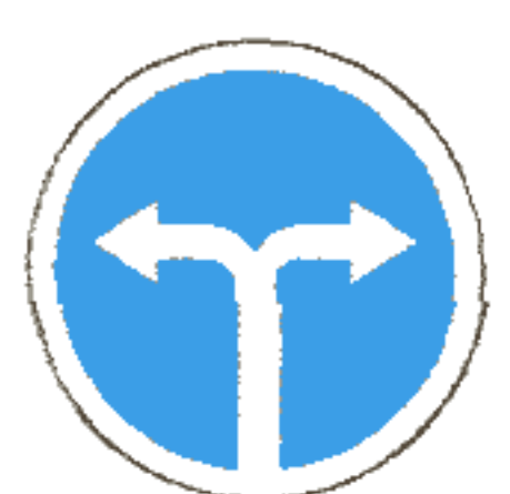
4.1.6 Движение направо или налево