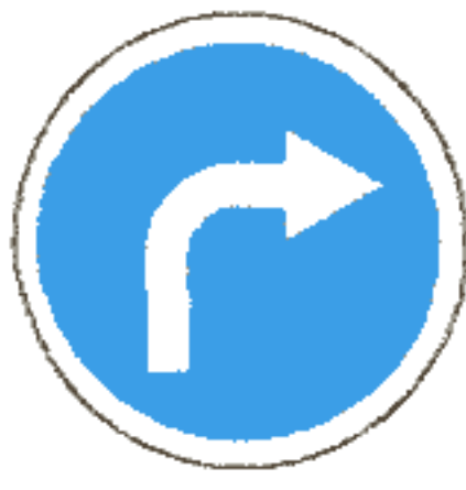
4.1.2 Движение направо