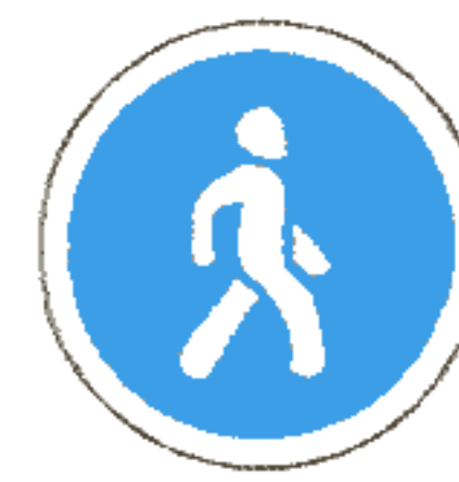
4.6.1 Пешеходная дорожка