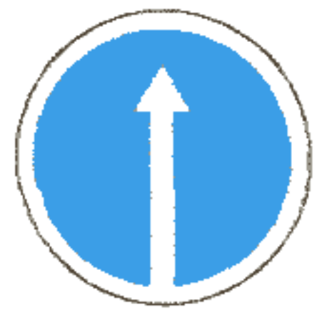
4.1.1 Движение прямо