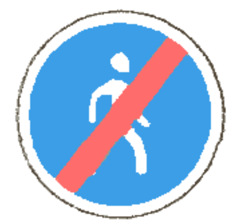
4.6.2 Конец пешеходной дорожки