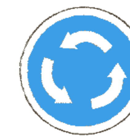
4.3 Круговое движение