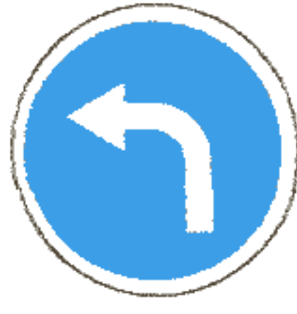
4.1.3 Движение налево