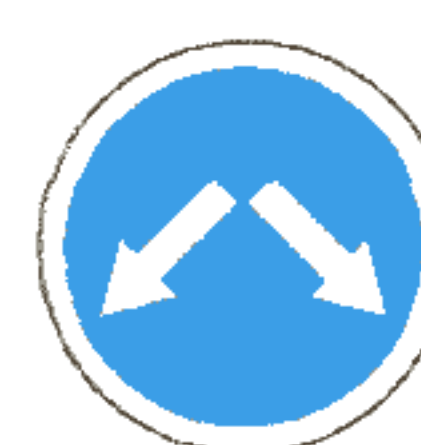
4.2.3 Объезд препятствия справа или слева